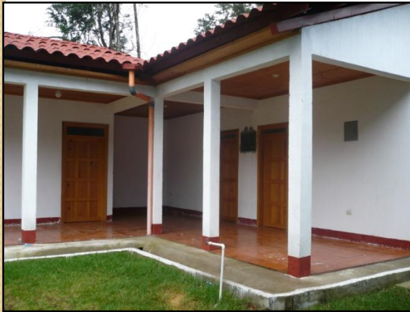
Vista de la casa materna