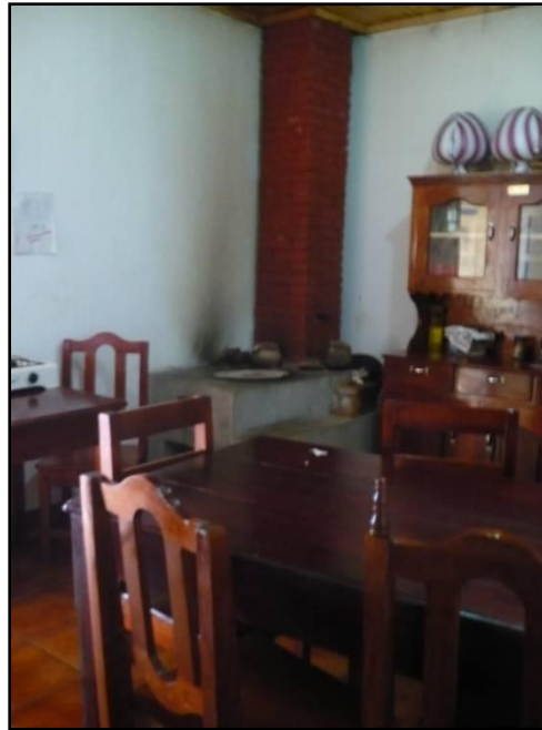
Cocina y comedor