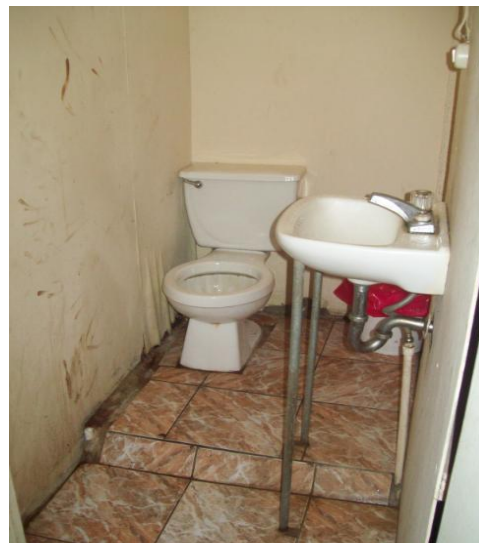
Fotografía albergue y baño del mismo