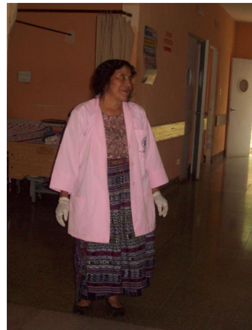
Comadrona de turno, localizada el día de la entrevista

Son financiadas por una organización canadiense. Los fondos finalizan este año y no podrán continuar financiando el trabajo de las comadronas