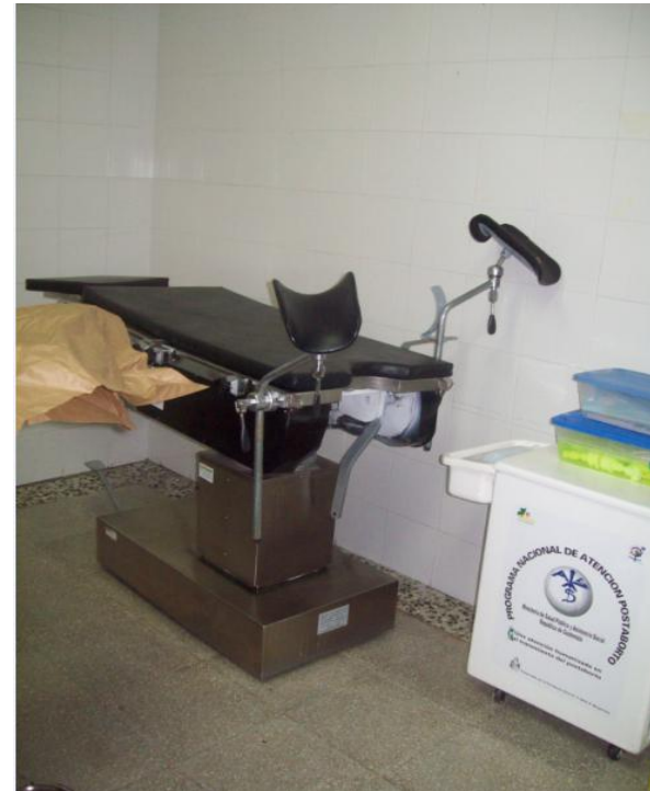
Equipo para la atención de partos